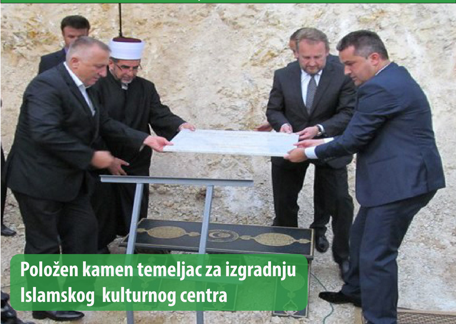
Položen kamen temeljac za izgradnju Islamskog kulturnog centra