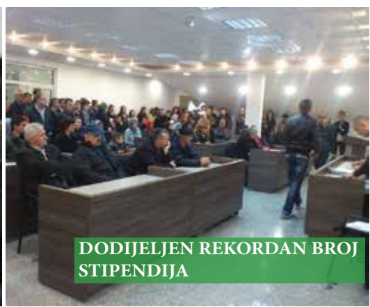
DODIJELJEN REKORDAN BROJ STIPENDIJA