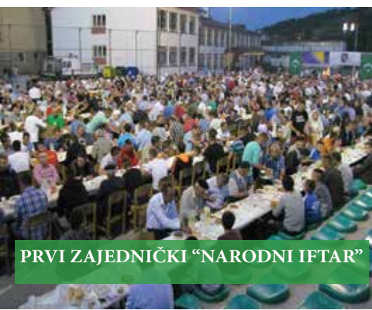
PRVI ZAJEDNIČKI "NARODNI IFTAR"